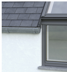
Flush dakrand detail