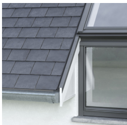
Lange overhangende dakranden

*Conform het erboven geplaatste hellende dakraam